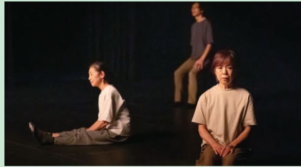
写真は澄井葵による演出

山本 浩貴さん Hiroki Yamamoto 1992年生まれ。「いぬのせなか座」主宰。小説の執筆、芸術の批評、書物のデザイン・出版、舞台の演出などを通じて、表現と生の関係可能性を検討・提示している。