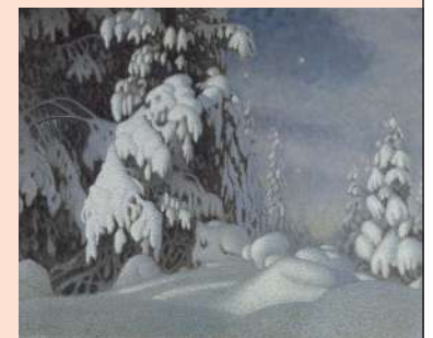
上. カール・ラーション《カードゲームの支度》1901年 油彩、カンヴァス スウェーデン国立美術館蔵 下. グスタフ・フィースタド《冬の月明かり》1895年 油彩、カンヴァス スウェーデン国立美術館蔵