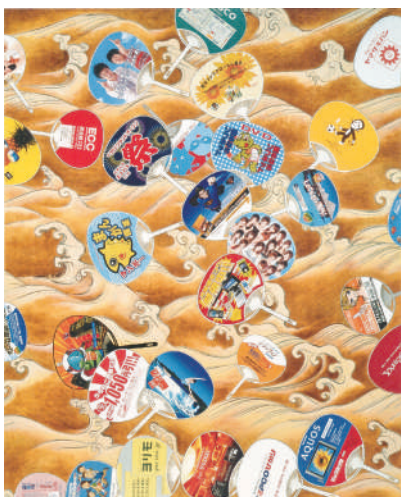
《扇面流図》2007年 愛知県美術館蔵

1963年東京都生まれ、同地在住。グラフィックデザイナーの福田繁雄を父に、童画家の林義雄を祖父に持つ。東京藝術大学美術学部絵画科油画を卒業後、同大学大学院修士課程を修了。89年、第32回安井賞を史上最年少で受賞。以降、美術館の所蔵作品や歴史的な図像、社会的な出来事などを手がかりに、絵画の枠組みそのものを問い直す作品を制作。国立国際美術館、東京都美術館、千葉市美術館、名古屋市美術館などで個展を開催。