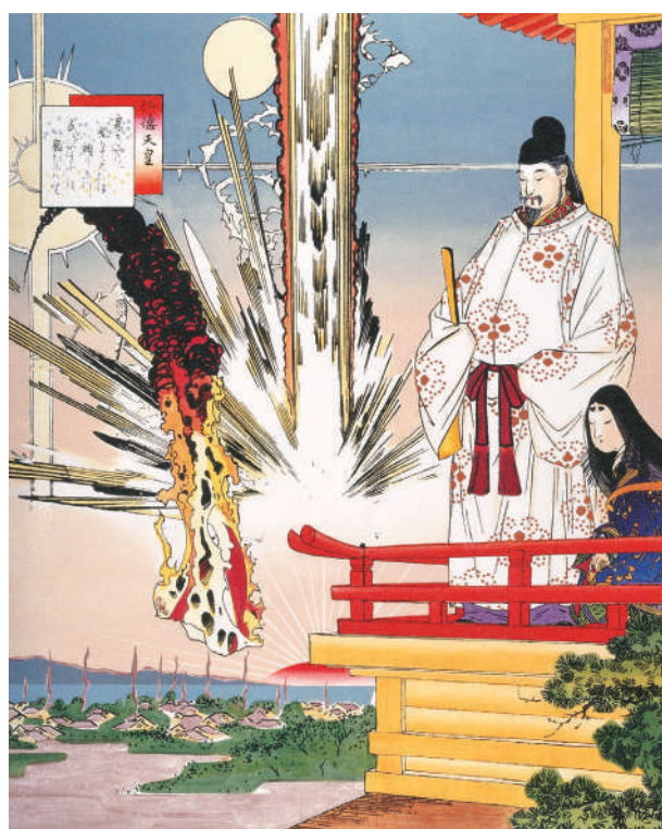
《高きやに 登りてみれば》1995年 愛知県美術館蔵

深 「流入してくる欧米文化」というご説明でしたが、この絵を描かれた1995年には阪神・淡路大震災や地下鉄サリン事件が起きていて、それも制作の契機かと推測している